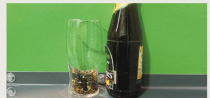
Tasa de reducción del volumen 5:1