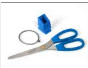
Kit de tijeras para Longopac Stand Dynamic, de material detectable de metal Item no. 34609 Kit que contiene unas tijeras de material detectable de metal, el soporte para las tijeras y alambre de acero inoxidable.