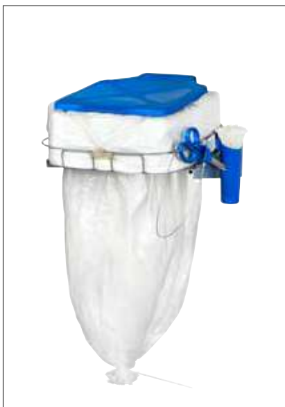
Mini Flex with lid

A continuación se han añadido dos nuevos productos. Mini Flex con tapa y la primera versión Midi. Las soluciones para colgar en la pared son muy adecuadas para superficies con espacio limitado y donde la higiene juega un papel importante. Facilita la limpieza.