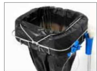
Banda elástica Item no. 3102 Este accesorio se puede utilizar con todos los portabobinas (bastidores) de Longopac. Bloquea eficazmente la bobina (bolsa) y evita que se despliegue.