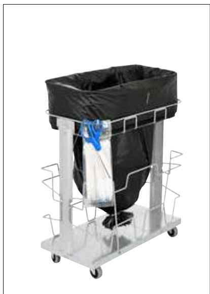
Stand Dynamic UBS