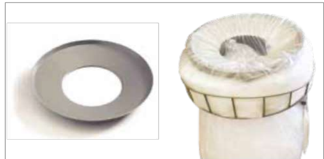
Placa reductora de agujero para Longopac Stand Classic Maxi Item no. 30170 Reduce la abertura de introducción, lo que facilita la compresión de, por ejemplo, plástico retornable. Solo está disponible para el modelo Maxi.