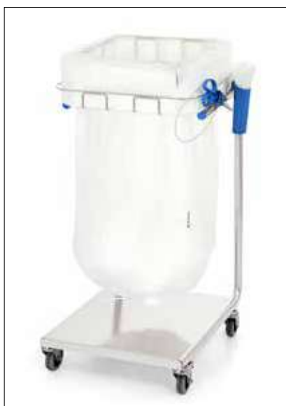
Stand Dynamic Midi/Midi Pedal