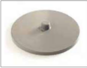
Tapa para Longopac Stand Classic Maxi y Mini Mini. Item no. 31140 Maxi. Item no. 30140