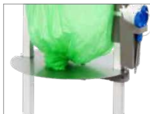
Placa ajustable para Stand Classic Mini Item no. 31480 Reduce el consumo de material de las bolsas y el tamaño de las mismas. Destinado principalmente a residuos pegajosos y pesados. Se puede utilizar perfectamente para bobinas de bolsas biodegradables.