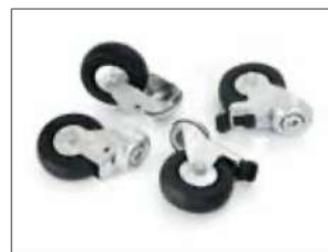
Kit de Ruedas Stand Dynamic ESD Item no. 34616 Incluye cuatro ruedas giratorias, dos de ellas con frenos. Reemplaza las ruedas originales en los soportes utilizados en áreas restringidas de ESD.