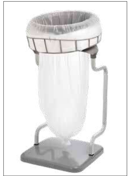
Stand Classic Recycling