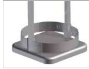
Marco para Longopac Stand Classic Maxi Item no. 33900 El marco mantiene la bolsa en su sitio.