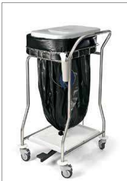
Stand Midi Nouvo Pedal