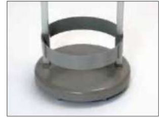
Marco para Longopac Stand Classic Mini Item no. 33890 El marco mantiene la bolsa en su sitio.