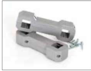
Acoplamiento de unidades con Longopac Stand Classic Item no. 33750 Acopla de forma fácil y estable dos o más unidades Longopac Stand. Incluso se puede acoplar Maxi con Mini.