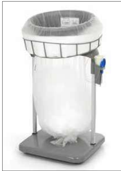
Stand Classic Maxi/Maxi Food