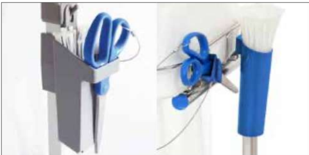
Soporte de presilla para Longopac Stand Classic Estándar, gris. Item no. 30410 Metal detectable, azul. Item no. 30416 El soporte de presilla agiliza el cambio de la bolsa aún más y mantiene la presilla en la posición correcta. Adecuando tanto para Maxi como Mini y viene en dos modelos.