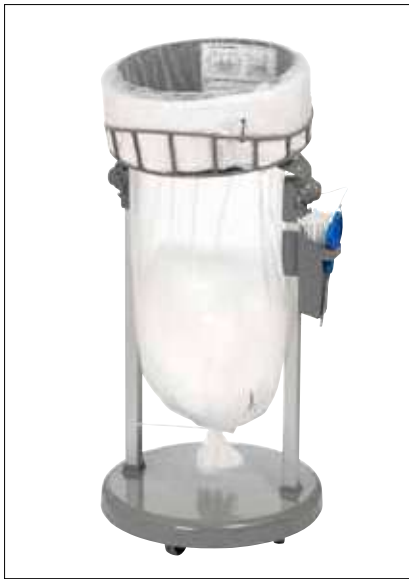
Stand Classic Mini/Mini Food