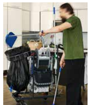
El sistema Longopac está disponible en una amplia gama de diseños para adaptarse a distintos objetivos. Paxxo también ofrece soluciones que detectan los metales para aquellos entornos que lo precisen.