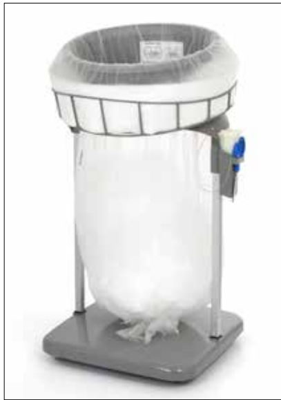
Stand Classic Maxi/Maxi Food