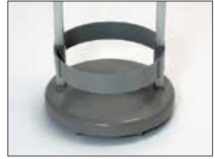
Marco para Longopac Stand Classic Mini Item no. 33890 El marco mantiene la bolsa en su sitio.