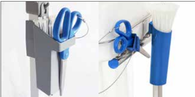
Soporte de presilla para Longopac Stand Classic Estándar, gris. Item no. 30410 Metal detectable, azul. Item no. 30416 El soporte de presilla agiliza el cambio de la bolsa aún más y mantiene la presilla en la posición correcta. Adecuando tanto para Maxi como Mini y viene en dos modelos.