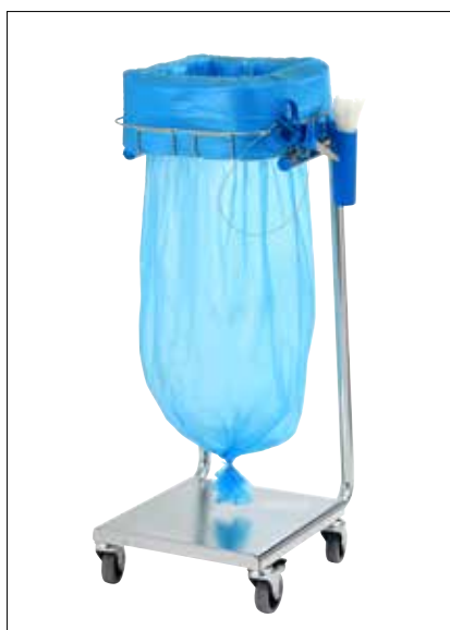
Stand Dynamic Mini/Mini Pedal