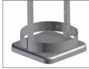
Marco para Longopac Stand Classic Maxi Item no. 33900 El marco mantiene la bolsa en su sitio.