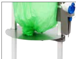
Placa ajustable para Stand Classic Mini Item no. 31480 Reduce el consumo de material de las bolsas y el tamaño de las mismas. Destinado principalmente a residuos pegajosos y pesados. Se puede utilizar perfectamente para bobinas de bolsas biodegradables.