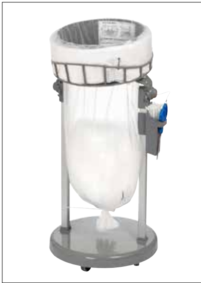
Stand Classic Mini/Mini Food