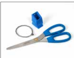
Kit de tijeras para Longopac Stand Dynamic, de material detectable de metal Item no. 34609 Kit que contiene unas tijeras de material detectable de metal, el soporte para las tijeras y alambre de acero inoxidable.