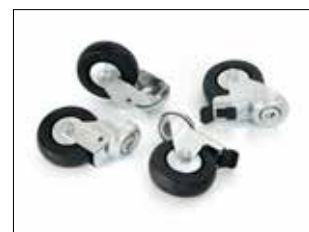
Kit de ruedas ESD para Longopac Stand Dynamic Item no. 34616 Incluye cuatro ruedas giratorias, dos de ellas con frenos. Reemplaza las ruedas originales en los soportes utilizados en áreas restringidas de ESD.