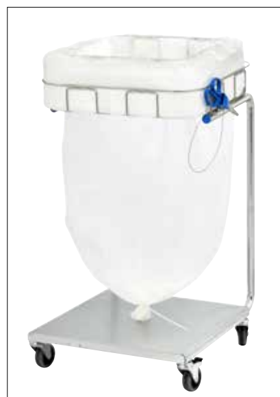
Stand Dynamic Maxi/Maxi Pedal