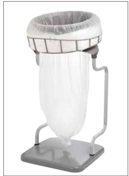
Stand Classic Recycling