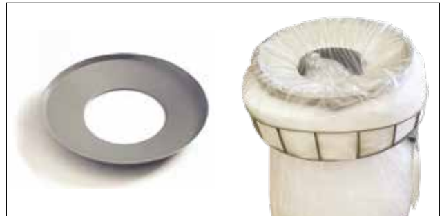
Placa reductora de agujero para Longopac Stand Classic Maxi Item no. 30170 Reduce la abertura de introducción, lo que facilita la compresión de, por ejemplo, plástico retornable. Solo está disponible para el modelo Maxi.