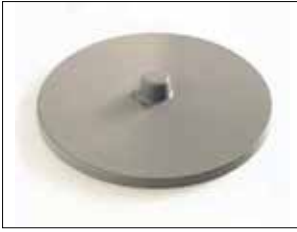
Tapa para Longopac Stand Classic Maxi y Mini Mini. Item no. 31140 Maxi. Item no. 30140