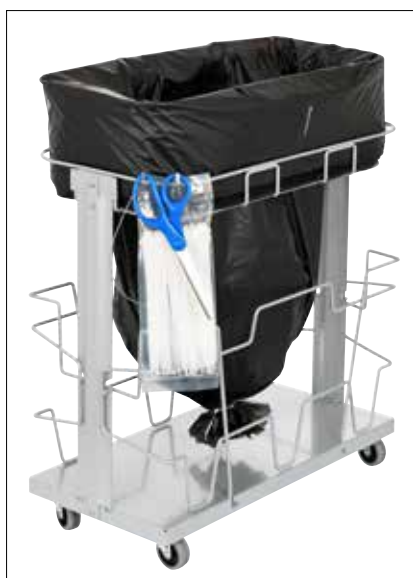
Stand Dynamic UBS