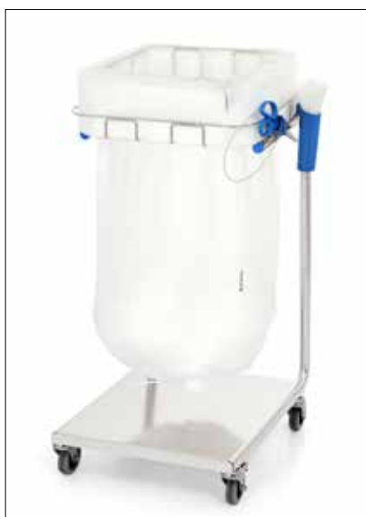
Stand Dynamic Midi/Midi Pedal